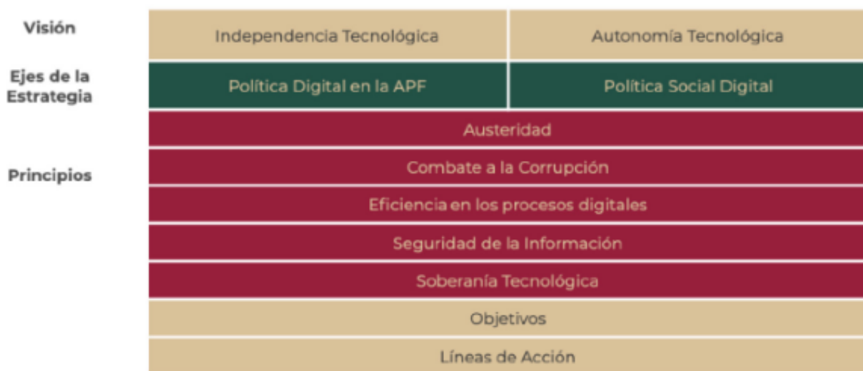
Figura 3. Marco estructural de la EDN

La siguiente figura esquematiza dicho marco estructural: