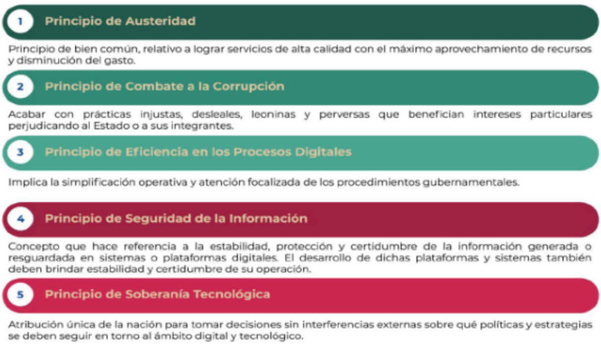
Figura 1. Principios de la EDN

Estos principios tienen sustento en una base humanista que privilegia el desarrollo técnico centrado en las personas; su seguridad ante usos o imposiciones tecnológicas arbitrarias; la transparencia de los códigos y algoritmos; el empleo de tecnologías robustas y fiables, su potencial libertario y beneficio social; sin restricciones a la libertad y la atención prioritaria de los grupos vulnerables.