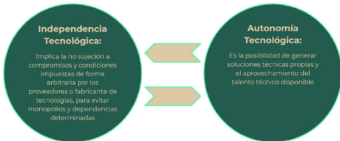
Figura 2. Visión de la EDN

Visión: Un país digitalizado y un gobierno austero, honesto y transparente, con autonomía e independencia tecnológicas, centrado en las necesidades ciudadanas, principalmente de los más pobres.